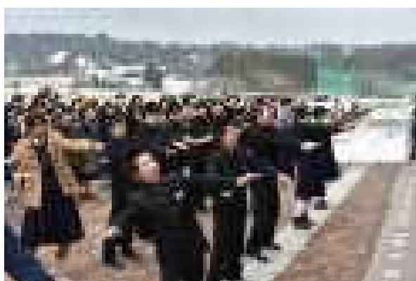
【残雪の中在校生のエール】