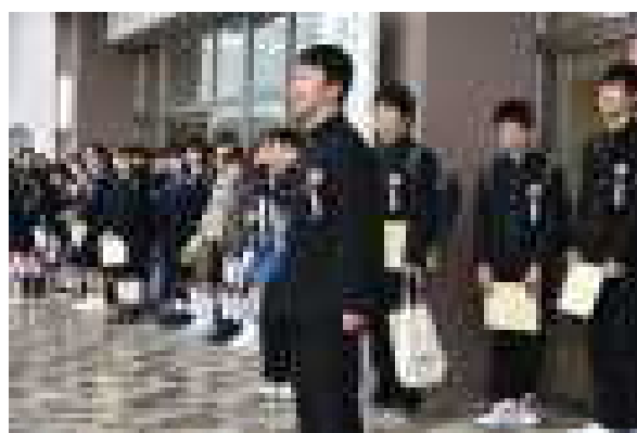
【エールに答えて最後のお礼】