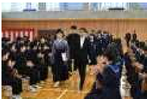
【恩師と共に堂々の入場】

我が南佐渡中学校は、佐渡の中で唯一、校名に「佐渡」を冠した学校です。これからも、みなさんが、この南佐渡中学校の卒業生であるという誇りを胸に、佐渡の若者として、ここ南佐渡の地から、そして故郷佐渡から、未来への希望に満ちた息吹を発信すべく、新たな第一歩を力強く踏み出されんことを祈念し、はなむけの言葉とします。